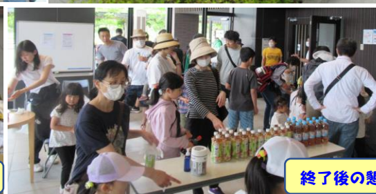
終了後の懇親会の様子