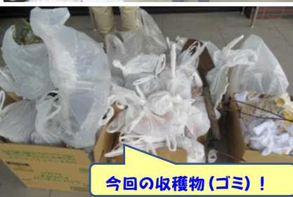
今回の収穫物(ゴミ)！